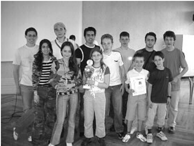
Die Siegermannschaft Düsseldorf I