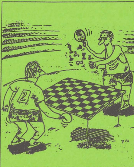
Schach für Deefo

In der Regionalliga spielte der DSV 1854 Düsseldorf am 9.2.97 gegen Holsterhausen 2 : 2. gez. C. Brebeck, Damenwartin