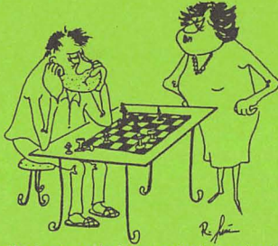
„Na, heute mal wieder vor'm Ingospiegel rasiert?“

(Auszug aus Protokoll von Schriftführer W. Kries)