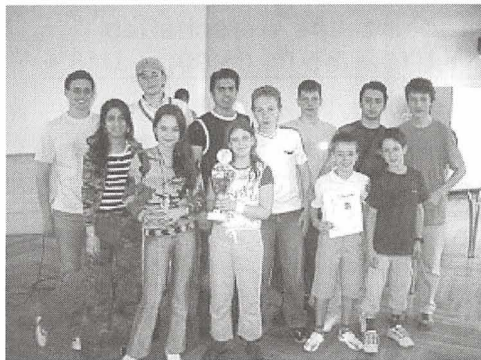
Die Siegermannschaft Düsseldorf I